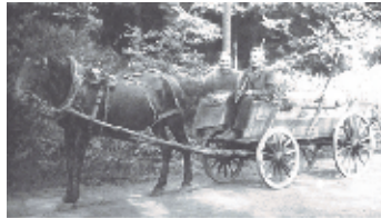
Topfhandl um 1920 bei Morsbach

Ein historischer Handelsweg über die Nutscheid Straße führte an Erdlingen - Mohrenbach in Richtung Freudenberg vorbei. Er ist, wie auch die „Broeder (Brüder) Straße bereits im alten „Deutzer Weistum“ von 1386 erwähnt. Wenn man also